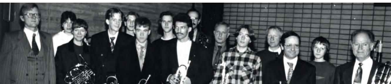
Posaunenchor im Jahr 1984

Und nun Radolfzell! in meinem Ruhestand. Zwar habe ich mittlerweile eine Ahnung von Tuten und Blasen, aber ob die mich als „Alten“ auch akzeptieren? Keine Frage! Hier sitze ich nun zwischen jung und alt, Mann und Frau. Und alle sind wir der Posaunenchor. Und wieder einmal bin ich Zuhause.