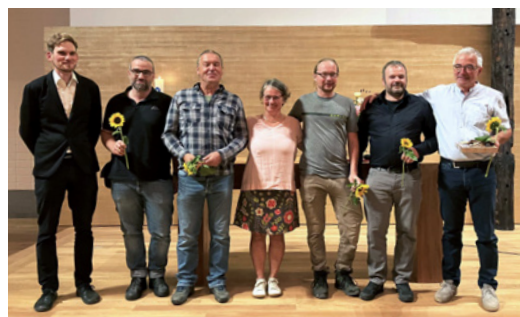
Rückblick auf unseren Eröffnungs-Gottesdienst in der neu renovierten Christuskirche.